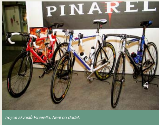
Trojice skvostů Pinarello. Není co dodat.