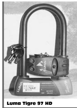
Luma Tigre 97 HD