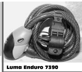
Luma Enduro 7390

Otom, že zajistit své kolo před ukradením na ulici není vůbec jednoduché, by mohl vyprávět každý kurýr. I většina cyklistů žijících ve větších městech často řeší podobný problém a vězte, že nechat si kolo zajištěné na některé pražské ulici pouze lanovým zámkem je vlastně totéž jako je vůbec nezamknout. Rozdíl je jen v tom, že případný lapka musí mít s sebou alespoň štipáčky.