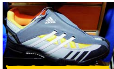
Čistá ševcovská práce v podání Adidasu.