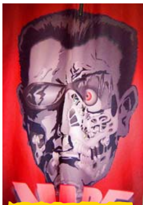
Detail z dresu od G-Sportu. Design pochází z dílny studia Wet Cat.