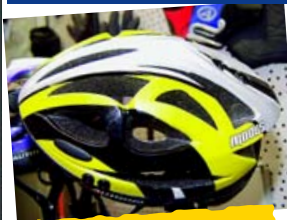
Author značně rozšířil nejen nabídku přileb.

Výstaviště v pražských Letňanech opět přivítalo výstavu Sport Prague. Ta se letos konala ve dnech od 26. února do 1. března. Ač se stále mluví o tom, že konkrétně cyklistika na této výstavě ustupuje, realita toto tvrzení až tak přesvědčivě nepotvrďila. I když ubyla nějaká část vystavovatelů, přibýlo i několik nových značek. Pro návštěvnost výstavy byl jistě přínosem i fakt, že se na výstavišti ve stejném termínu konala i výstava aut nebo například kosmetiky. Kdo má rád kola, většinou ho zajímají i auta. Z toho pravděpodobně pořadatelé do jisté míry vycházeli. Kosmetiku si pak lehce spleteš s autokosmetikou a jsme doma.