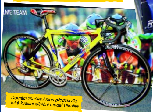
Domácí značka Anien představila také kvalitní silniční model Ultralite.