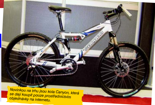
Novinkou na trhu jsou kola Canyon, která se dají koupit pouze prostřednictvím objednávek na internetu.